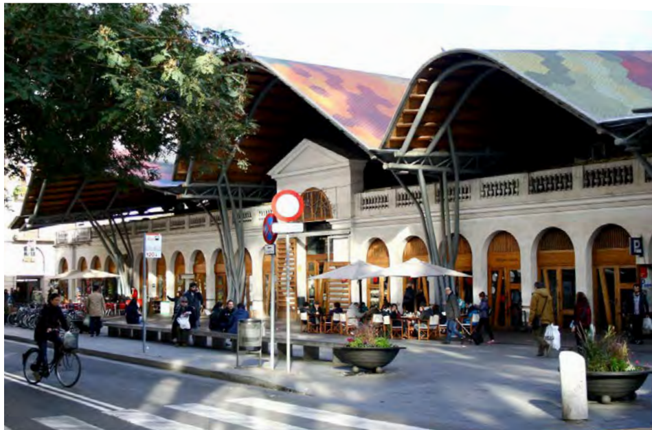
Figura 2. Mercat de Santa Caterina

comerciants del mercat van recolzar el projecte governamental i només es van mobilitzar quan van haver de negociar per la quantitat que havien de pagar per les reformes del mercat, així com per demanar explicacions pel retard en l'acabament de les obres.